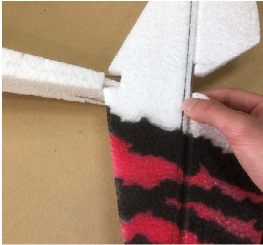
イメージ:1 (水平尾翼)