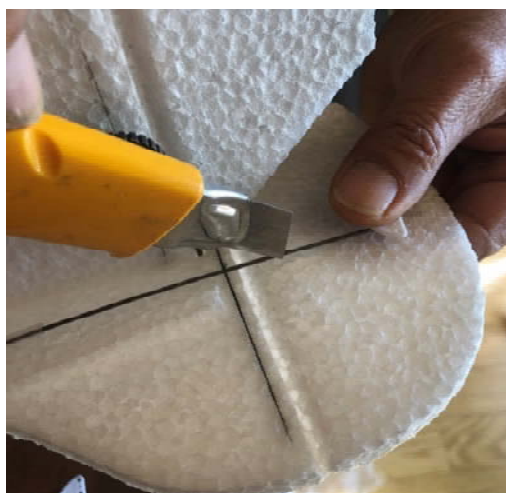
イメージ:5 (位置決め1)