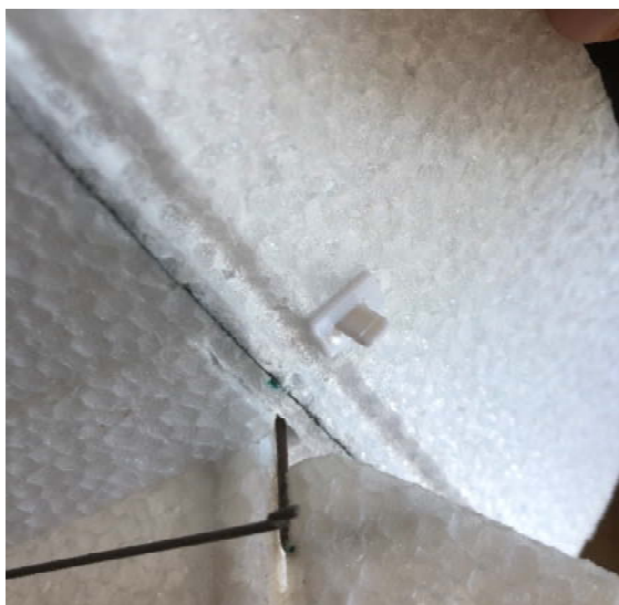
イメージ:7 (クリップで固定)