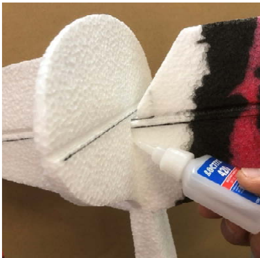
イメージ:4 (水平尾翼を接着する)